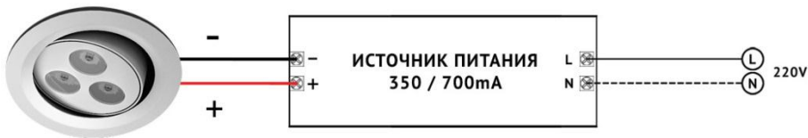
Схема последовательного подключения нескольких светильников к источнику питания с выходным током 350 / 700mA